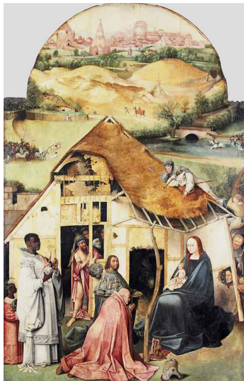
Niederländisch, »Anbetung der Heiligen Drei Könige«, Kopie nach Hieronymus Bosch, um 1530