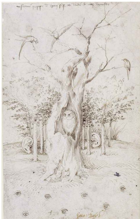
Hieronymus Bosch: »Das Feld hat Augen, der Wald hat Ohren«, um 1500-05

Bosch ist ein Zeitgenosse einer konfliktgeschwängerten Etappe der frühbürgerlichen Selbstbehauptung gegenüber Adel und Allmacht der katholischen Kirche, von Armutswanderungsbewegungen und Anwachsen der Stadtbevölkerung. Die Hochzeit der Gotik ist zugleich die Inkubationszeit für die Reformation. Europa befindet sich im Kräfte ringen zwischen Habsburgern, Rom und Frankreich. Und bald überall Hölle! Kein Zweifel über das infernalische Potenzial der Mächte bei Hieronymus Bosch. Ein Albraum auch bei Jan Wellens de Cock, dessen »Höllenslandschaft« mit boschhaftem Kopffüßler in der Bildmitte um 1480-1521 in Antwerpen entstanden ist. Grafisch virtuos wird gefoltert, gelyncht, gefressen, gehängt und herumgekröchen.